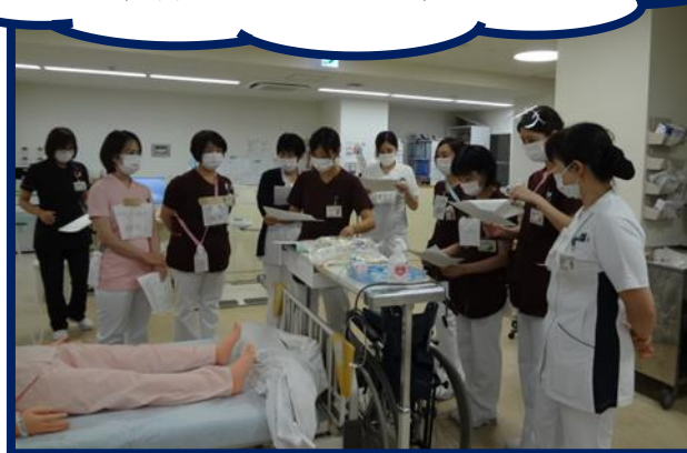
訓練前のミーティング